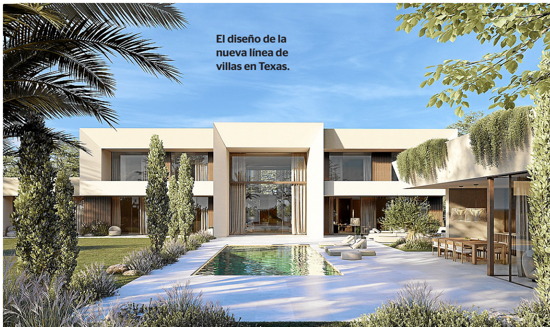
El diseño de la nueva línea de villas en Texas.